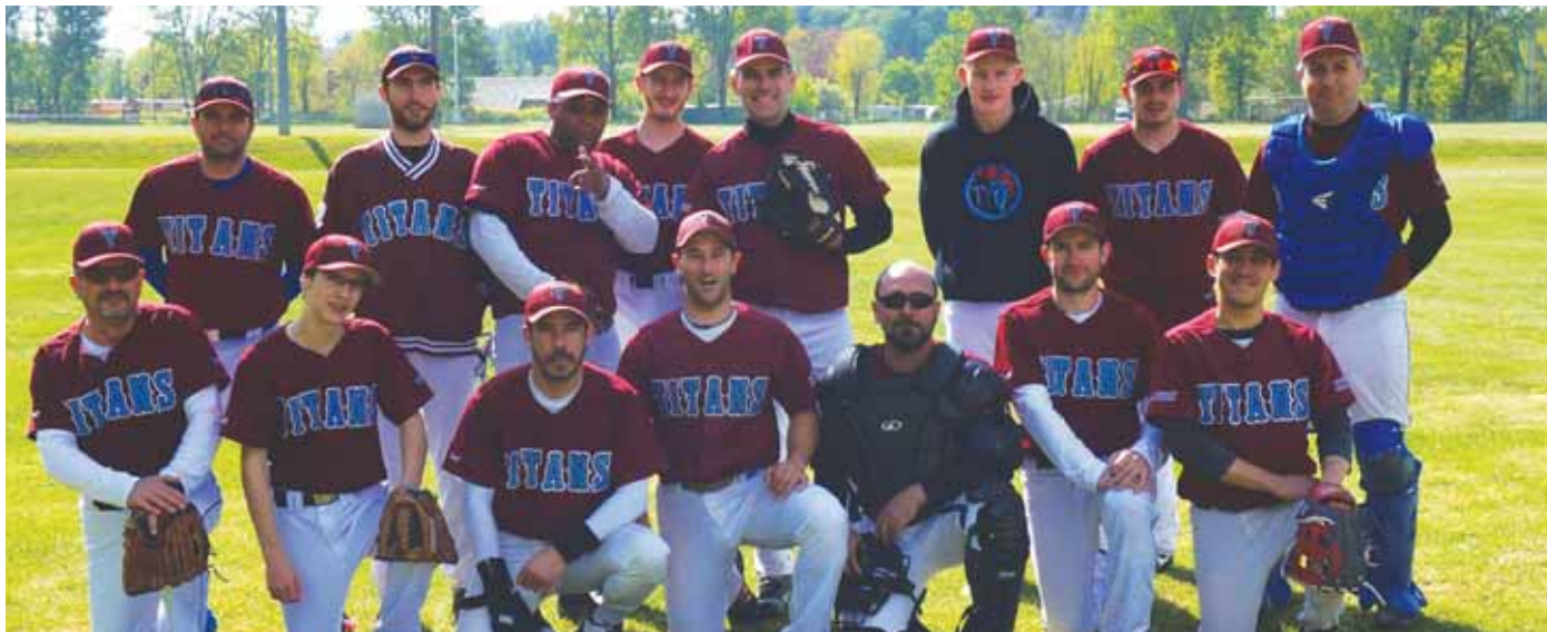
• L'équipe seniors des Titans dispute le championnat régional de Bourgogne-Franche-Comté.

Présente jusqu'au début des années 2000 à Dole, l'activité baseball est de nouveau pratiquée avec le club Les Titans qui compte une quarantaine de membres. Dont une dizaine de jeunes de moins de 15 ans.