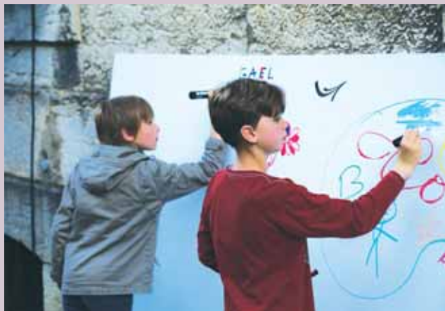
• Lors de la nuit des musées 2017.

du récent concert de Jordi Savall. Le 9 juin, le chœur de l'opéra de Dijon participera à une journée jazz à l'occasion des 300 ans de la fondation de la Nouvelle-Orléans. Enfin, depuis trois ans, le festival de musique de Besançon Franche-Comté a inclus Dole dans sa programmation. Prochain rendez-vous, le 13 septembre, à La Commanderie : l'orchestre et le chœur Les siècles romantiques donneront un concert "100% Beethoven". Parce que toutes les musiques doivent s'épanouir, des plateaux rocks confiés à des groupes dolois vont se faire entendre cet été et un partenariat avec le moulin de Brainans est à formaliser pour l'accueil de concerts durant la saison 2018/2019.