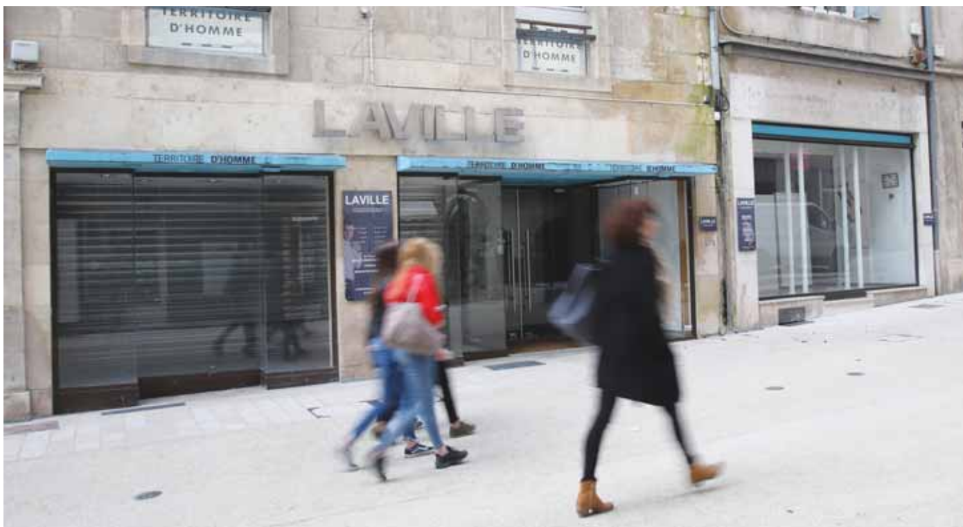
● Le 44 Grande rue, en voie de retrouver une activité.

À travers la société publique locale Grand Dole Développement 39, présidée par le maire de Dole, la collectivité souhaite acquérir deux locaux commerciaux de la Grande rue. Objectif : lutter contre la vacance commerciale.