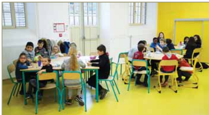
• En fin d'après-midi, les écoliers prennent leur goûter dans les nouveaux locaux.

Rue Faustin-Besson, les locaux occupés jusqu'à l'été dernier par la halte-garderie L'île enchantée ont repris vie fin janvier. Après plusieurs mois de travaux, un espace dédié à l'accueil périscolaire des élèves de l'école Wilson a été aménagé.