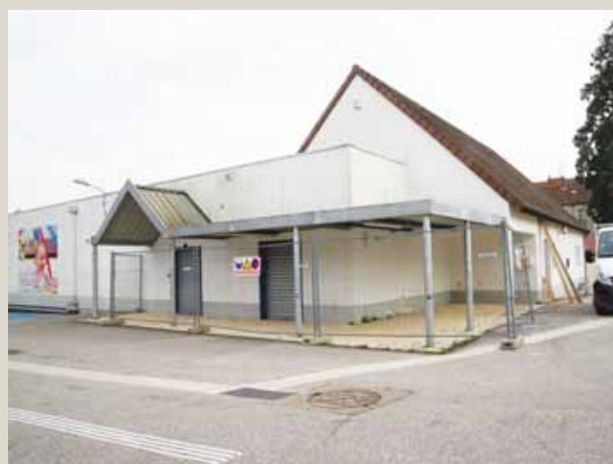
Rue Sombardier, les travaux d'aménagement de l'ancien magasin ont débuté en février.

Au cinéma Le Studio, la dernière séance est programmée mardi 24 avril. Cependant, les amateurs de films d'art et essai auront rendez-vous, dès le vendredi suivant, aux Tanneurs. La programmatrice de la MJC poursuivra en effet son travail, rue du 21 janvier. Le projet de multiplex sur la rive gauche est en cours d'élaboration en intégrant le cinéma art et essai porté par la MJC.