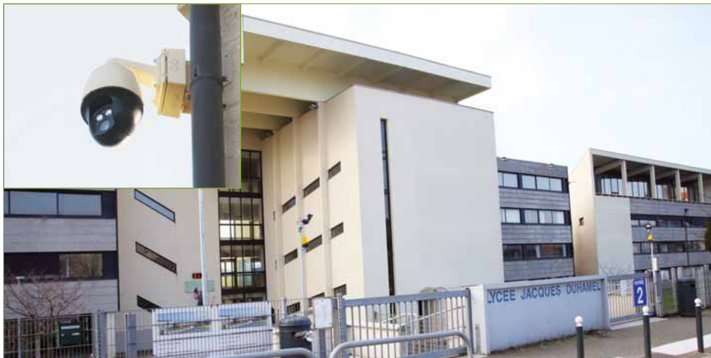
● Les abords du lycée Duhamel seront prochainement protégés par des caméras.