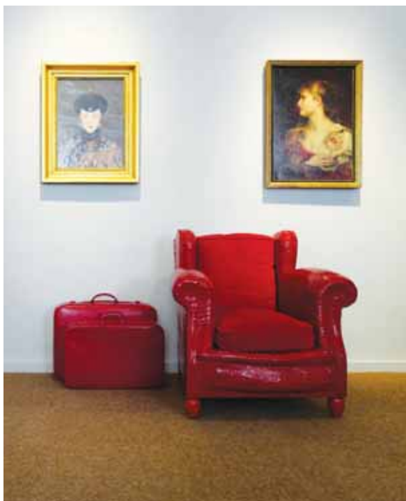
● Les œuvres d'Étienne Bossut ont investi tous les espaces du musée y compris les collections permanentes.