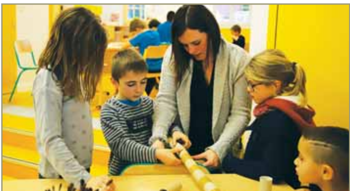
• Les enfants ont entrepris de décorer leurs nouvelles salles d'activités