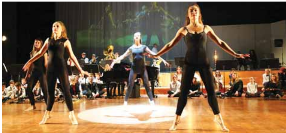
• Des danseuses se sont invitées lors de la traditionnelle Sainte-Cécile