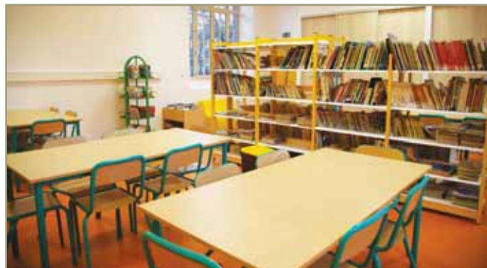
• Une bibliothèque mutualisée avec l'école a été aménagée.