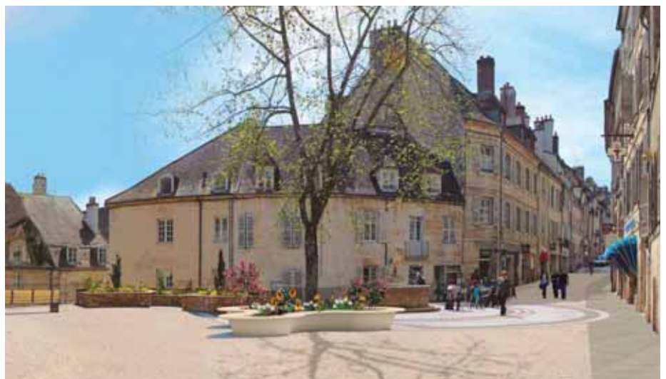
• Les futurs aménagements de la Place aux Fleurs © Cabinet Serge Roux

L a troisième et dernière phase des travaux de rénovation du centre-ville concernera la place aux Fleurs et la partie piétonne de la rue des Arènes. Au final, les artères principales du centre-ville auront donc été traitées, après le secteur allant de la Grande rue à la rue de la Sous-préfecture (première phase en 2016-2017) et la rue de Besançon (deuxième phase en cours). Le projet a été présenté fin janvier aux commerçants de la zone qui en ont accepté les modalités. Les aménagements seront réalisés dans la continuité de ceux déjà effectués : pieds de façade en pierres, partie centrale de la rue en béton sablé, nouveau mobilier urbain et fleurissement amélioré.